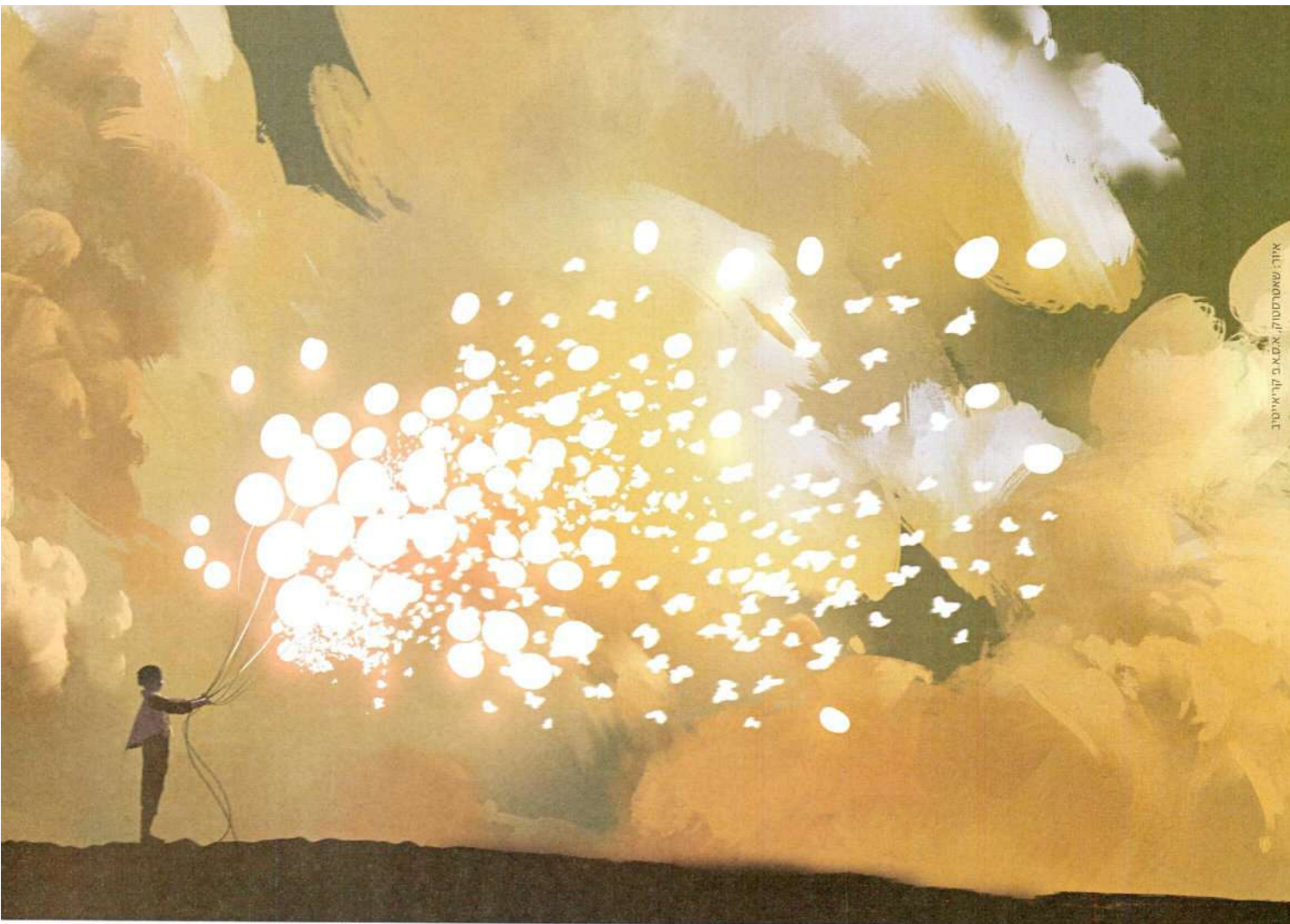
איור: שמעון יצחק

פרופ' עודד מימון: "מדובר בשפה חדשה, שבה הבסיס המתמטי גמיש וקולט חוויות ואפשרויות שונות. זה לא או-או, אלא גם וגם. גם להיות מדויק, אבל גם לאפשר חוות דעת סובייקטיבית. אלה תהליכים גדולים מאיתנו. אני עושה מדיטציה ורואה בה חיזוק לעבודה שלי כמתמטיקאי, שכן באמצעותה אני מקבל רעיונות"