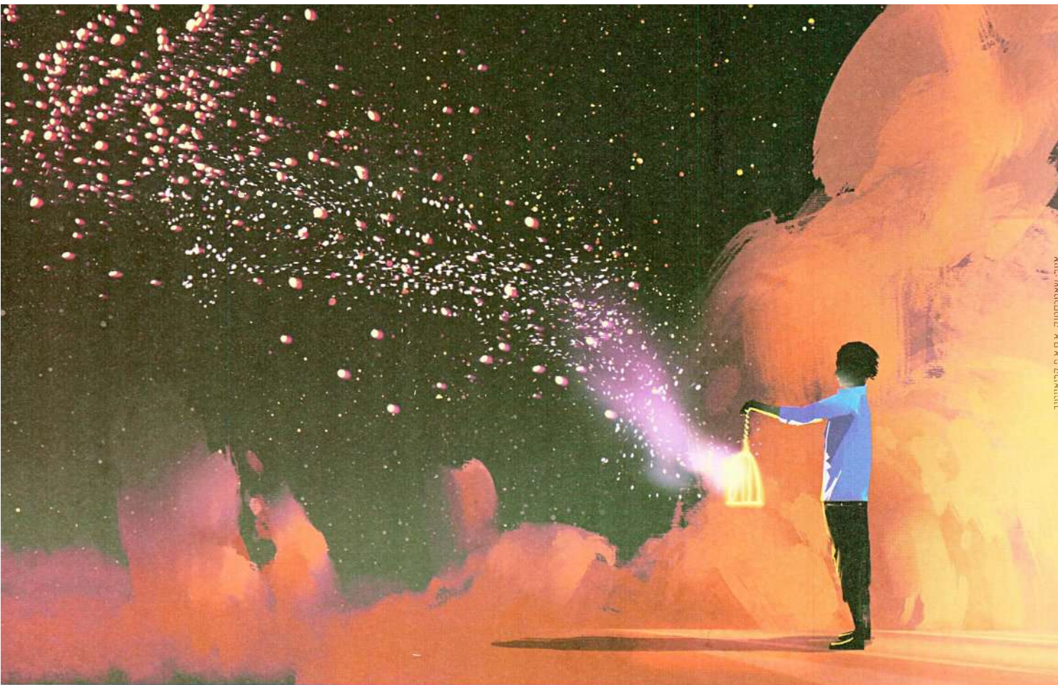
אור: שאטרסטרן, א.ס.א. קרייאטיב

ד"ר דב ינאי: "התודעה קשה להגדרה. ברגע שנגדיר אותה היא אינה תודעה עוד, כמו הדאו דה צ'ינג ונוכחות. זה כמו תחנת טלוויזיה - אנחנו המכשיר, והתודעה היא היכולת שלנו לקלוט תכנים ושידורים ולהפוך אותם לגשמיים. היא האנטנה. ואולם, לא ברור היכן היא נמצאת - במוח? בכל הגוף? אנחנו נמצאים בתקופה היסטורית משמעותית, שמכריחה את האנושות לאחד את המדע עם הרוח"